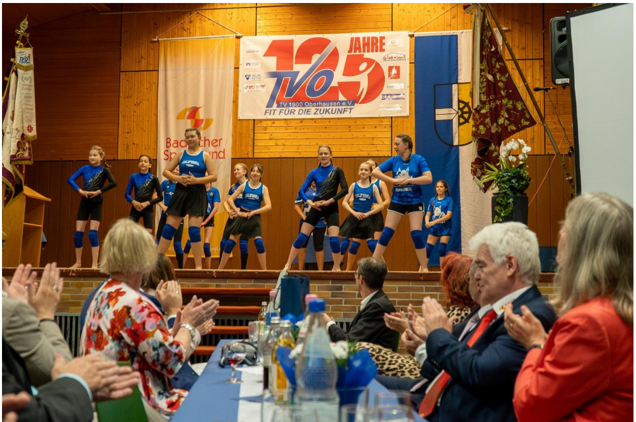
Tanzeinlage der Tanzmäuse- Ein Überblick durch die Sportarten im Verein