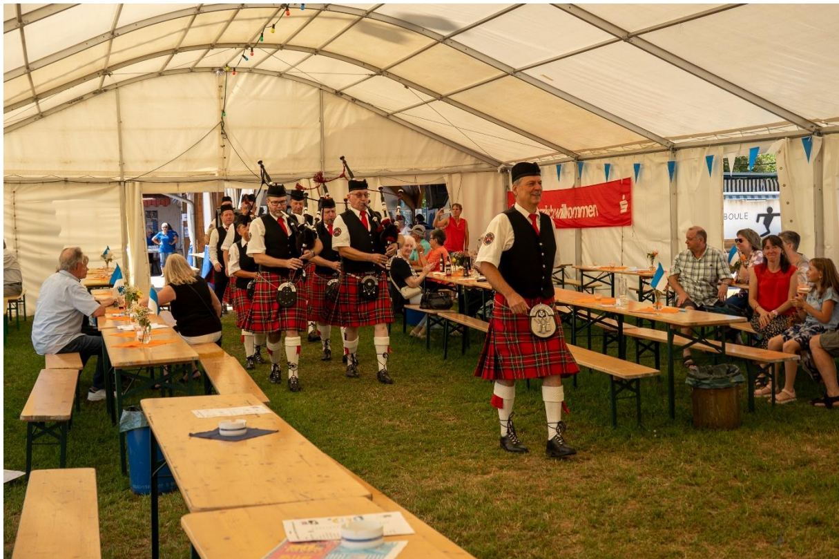
Die Strasser Garde Rheinhausen sorgte für die musikalische Unterhaltung beim Frühschoppen.