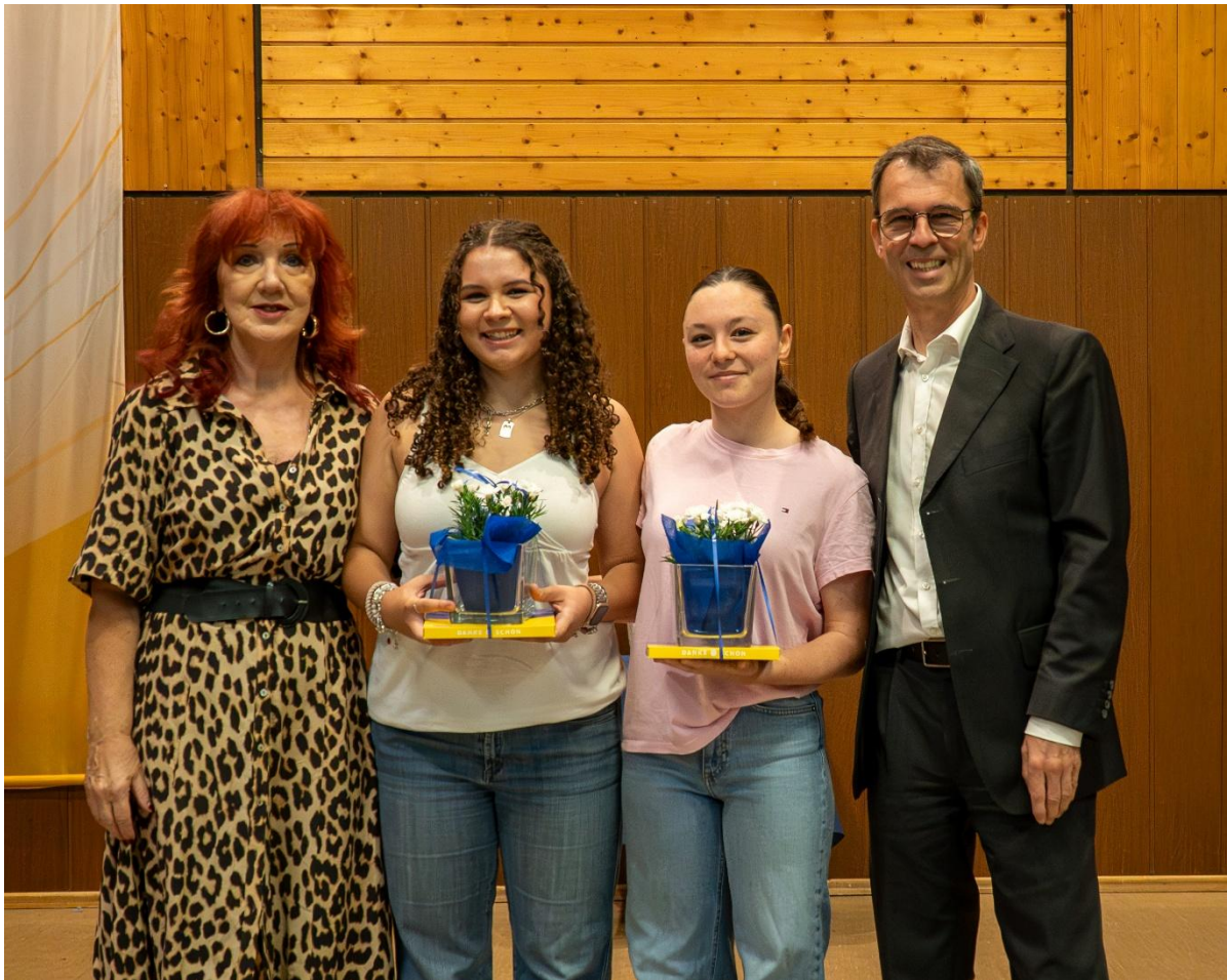
Ann-Sophie Megerle und Sophie Scholl trugen die Vereinsgeschichte vor