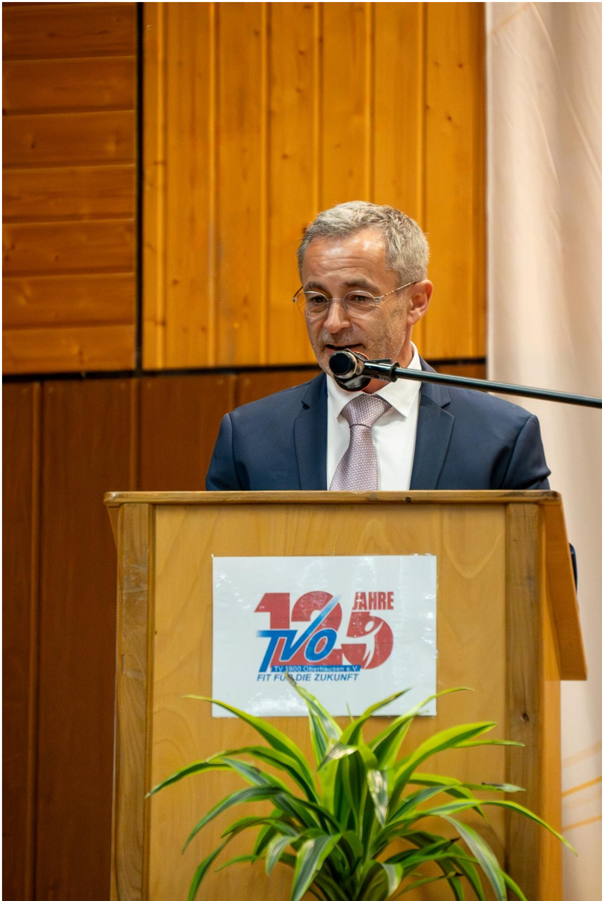
Alfons Hölzl, Präsident des Deutschen Turner-Bundes, hielt die Festrede