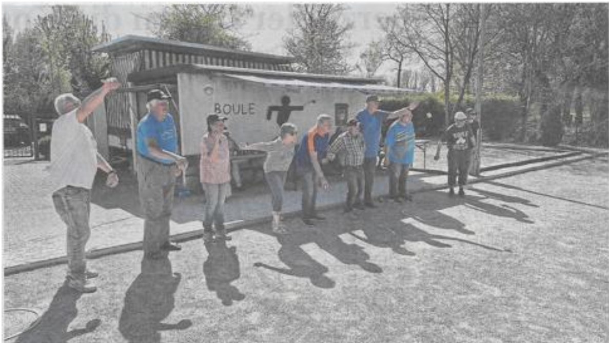
Übung macht die Meister. Hier das Boule-Team des TV 1900 Oberhausen. Auf dem Gelände des Vereins neben der Radrennbahn sind die Vorkehrungen für das Sport-Event bereits getroffen.