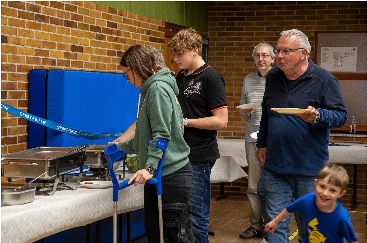
Mit dem Abendessen und den folgenden Gesprächen ging das Jubiläum deinem Ende entgegen.