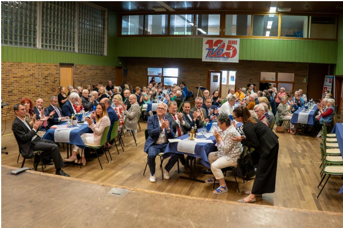
Die TV-Halle war wieder mit Gästen aus Politik, Sport und Mitgliedern gefüllt.