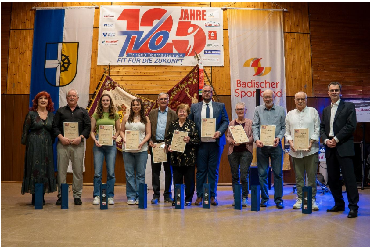
Vereinsehrungen durch die Vorstandschaft