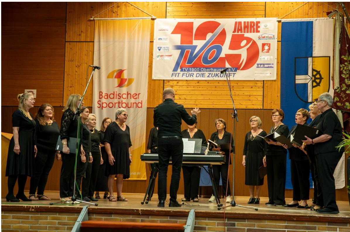
Gesangseinlage des Chors Klangfusion aus Rheinhausen