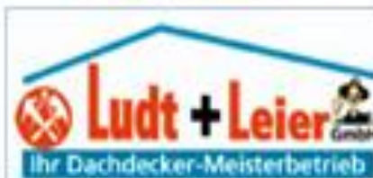
Ludt & Leier Dachdecker