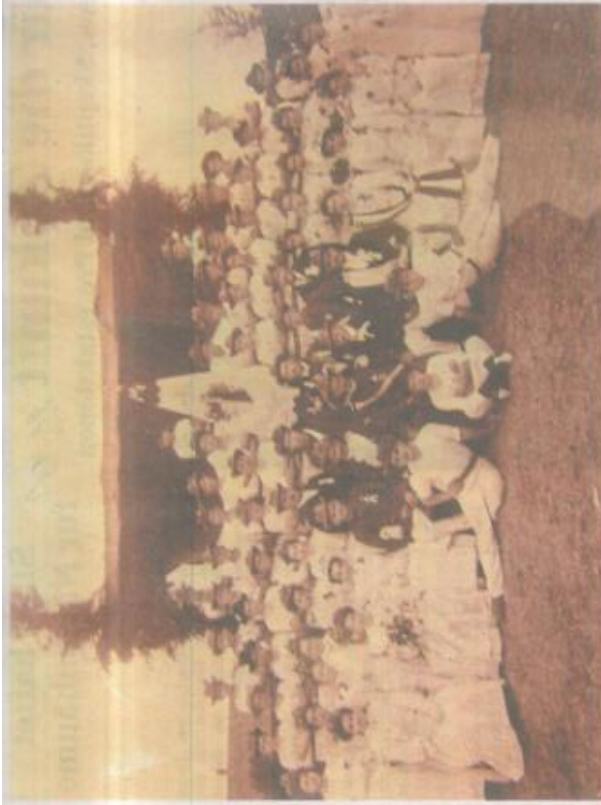
Sieben Jahre nach der Gründung des TV 1900 Oberhausen wird im Rahmen des Gaurunfests erstmals eine Vereinsfeier des TVO geweiht.