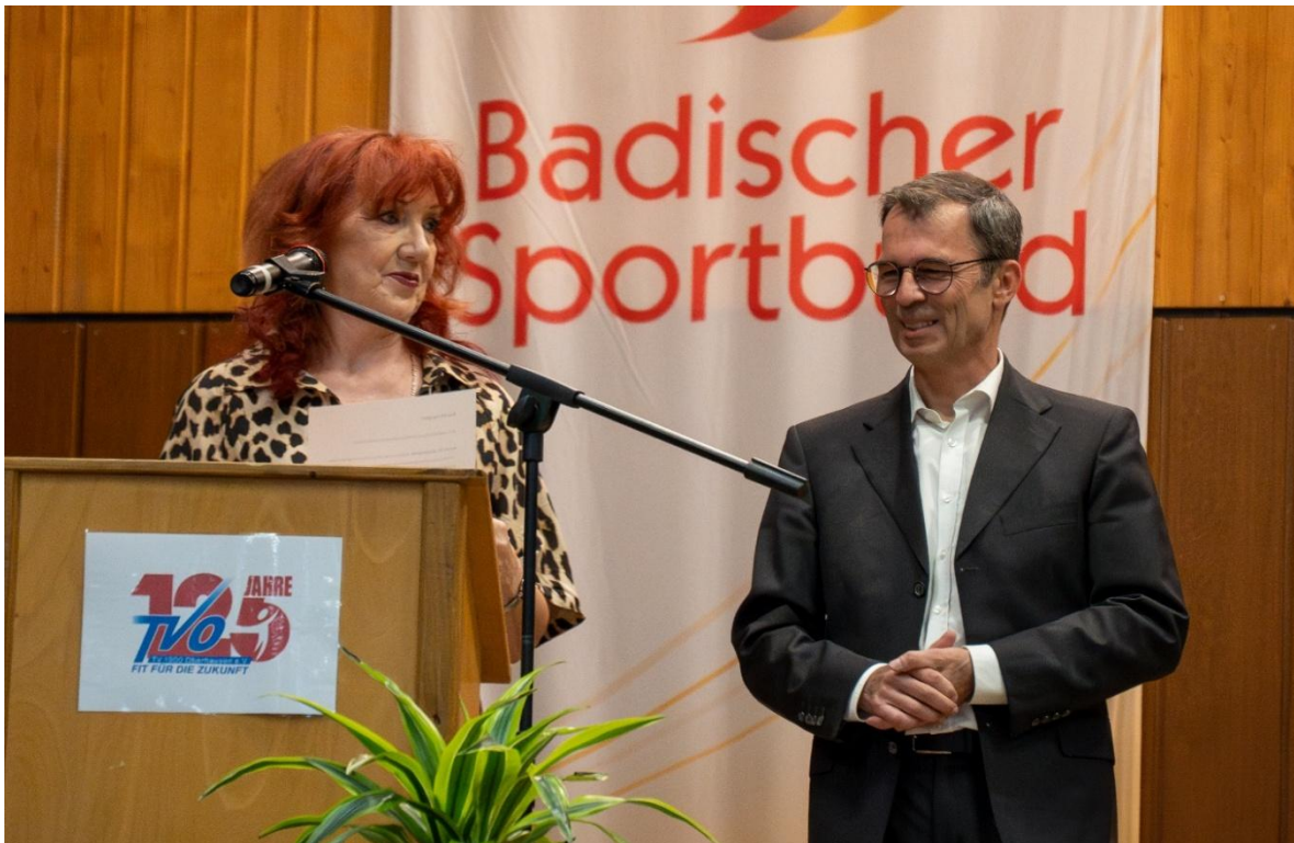
Begrüßung durch die Vorstandschaft