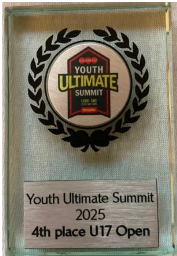
Die deutsche Auswahl belegte Platz 4 bei der EM in Schweden