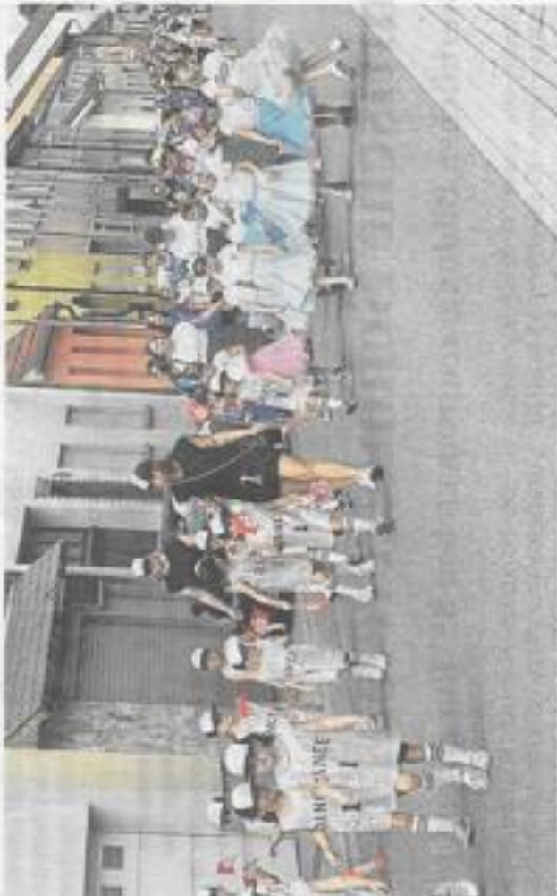
Die Tanzmädchen des TV Oberhausen sorgen beim 125-jährigen Vereinsjubiläum für ein buntes Bild beim Festzug.

Ergänzt wurde das Festprogramm durch ein Musik-Event, einen Schulkaktionstag der örtlichen Grundschulen sowie einen geselligen Abschlussbeim „Treffen der Generationen“. Nach dem Festzug der TVO-Abteilungen zum Jahnstadion füllte sich das Festzelt zur Autogrammstunde mit bekannten Sportgrößen aus der Region. Besonders gefragt war unter anderem der Kirrlacher Speerwerfer Andreas Hofmann, einer der weltweit