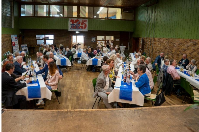
Die Vorstandschaft begrüßte die Gäste aus Politik und Sport sowie die Vereinsmitglieder