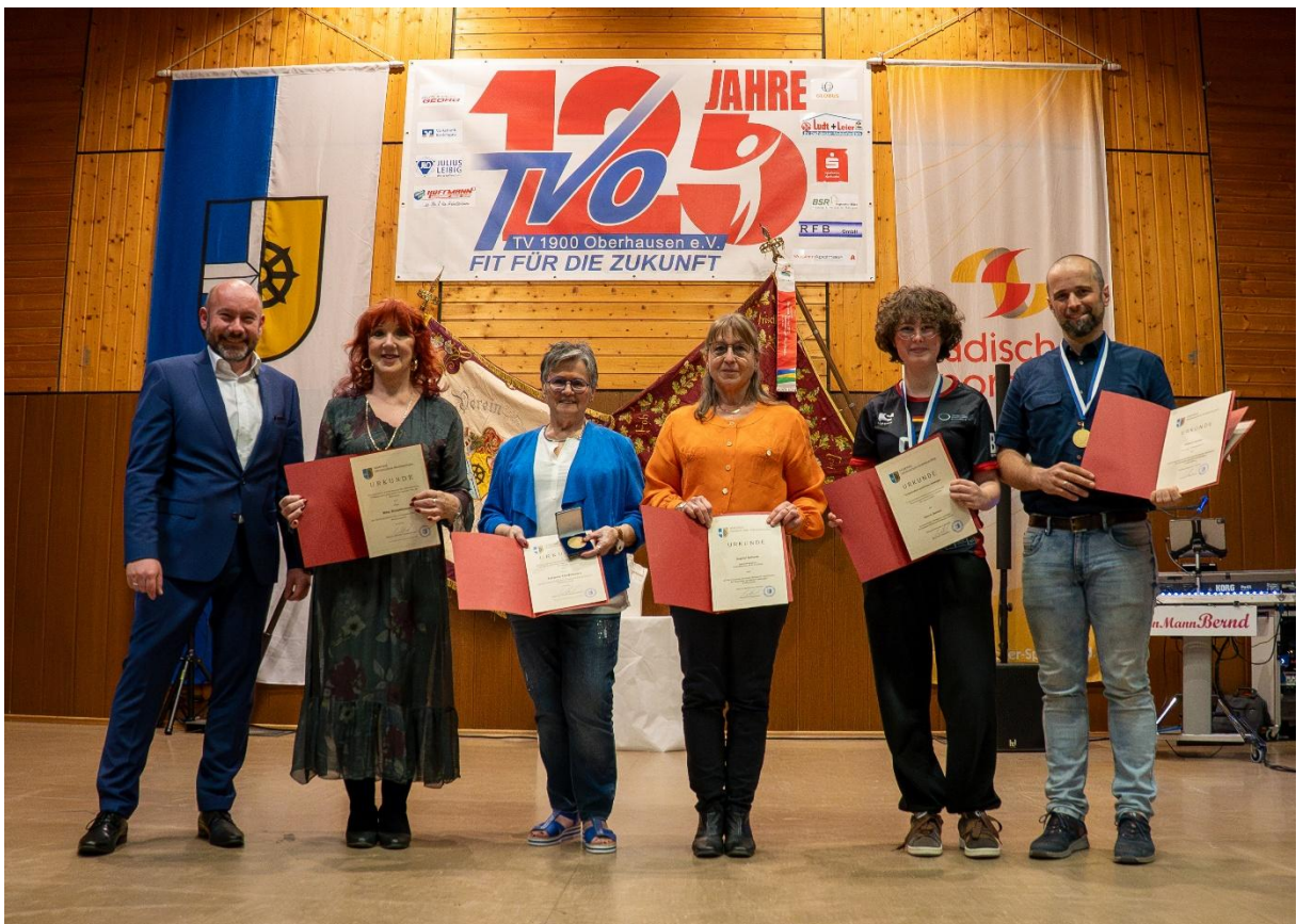
Gemeinde Ehrungen durch Bürgermeister Manuel Scholl