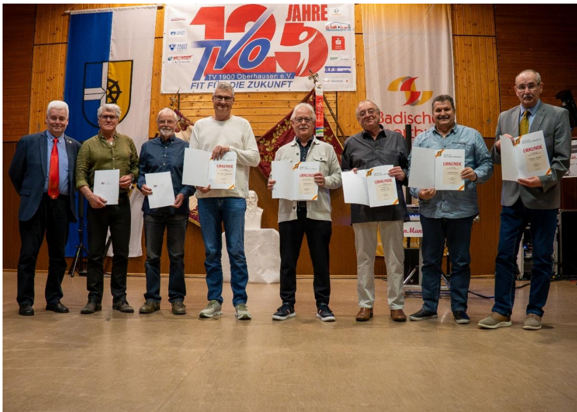
Verbandsehrungen der Tischtennisabteilung