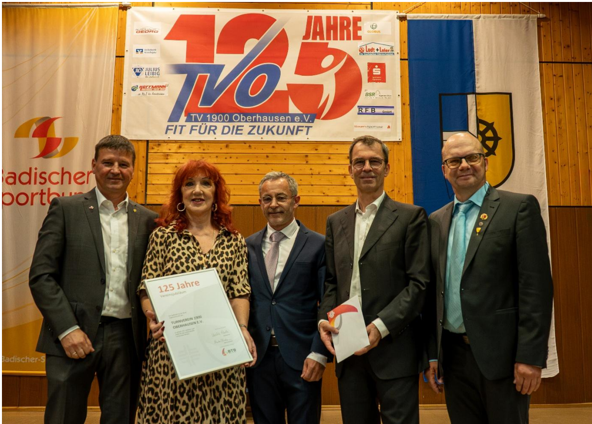
Übergabe der Jubiläumsurkunde des Badischen Turner-Bundes