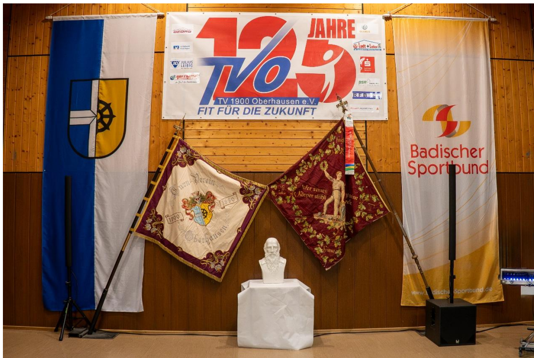
Festlich gezierte Bühne