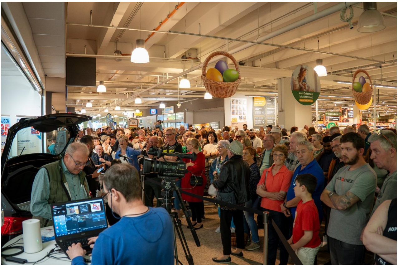
Viele der Loskäufer waren bei der Ziehung anwesend